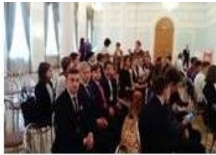
На встрече участников РДШ в Рязани.